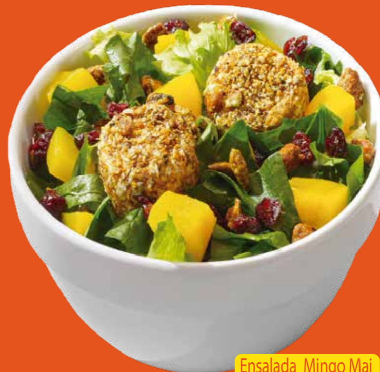
Ensalada Mingo Mai